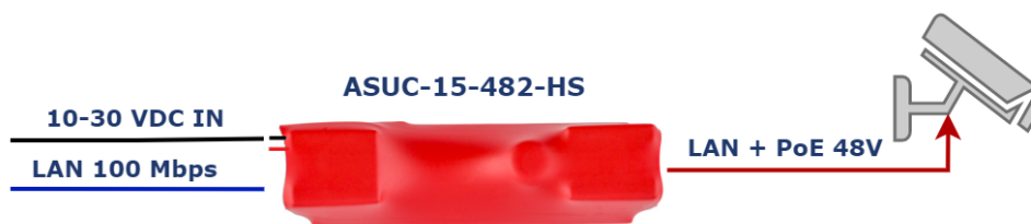
Typowa aplikacja urządzenia